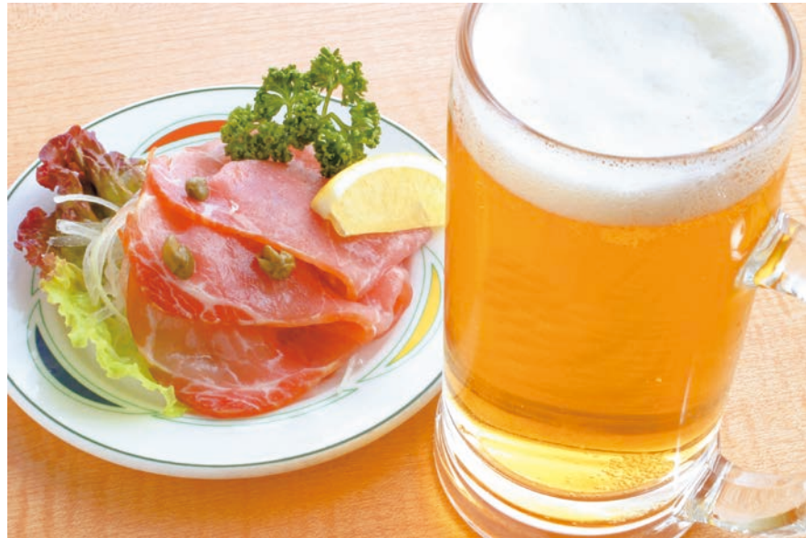
生ビールセット ●生ハムと生ビール 860円