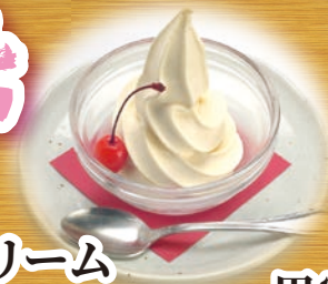
黒蜜きな粉ソフトクリーム 390円