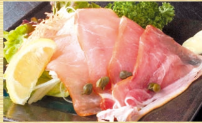
生ハム(ラックスハム)オニオン 610円