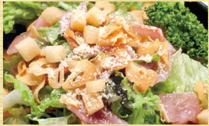
ガーリックシーザーサラダ 530円